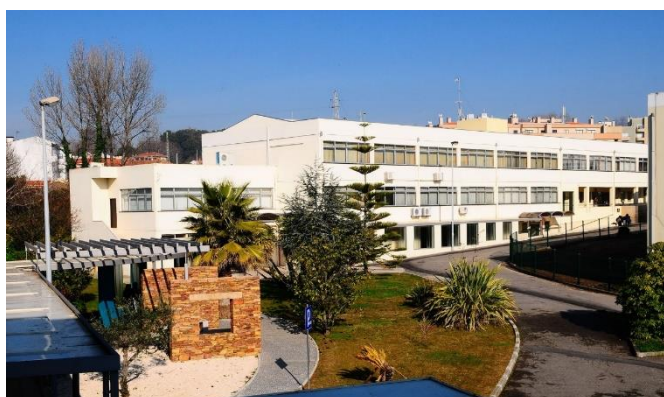
Instalações do CRPG

Em 2022, o CRPG obteve o reconhecimento “Committed to Excellence” 3 Star, da EFQM, cujo Modelo de Excelência é utilizado por mais de 30 000 organizações na Europa.